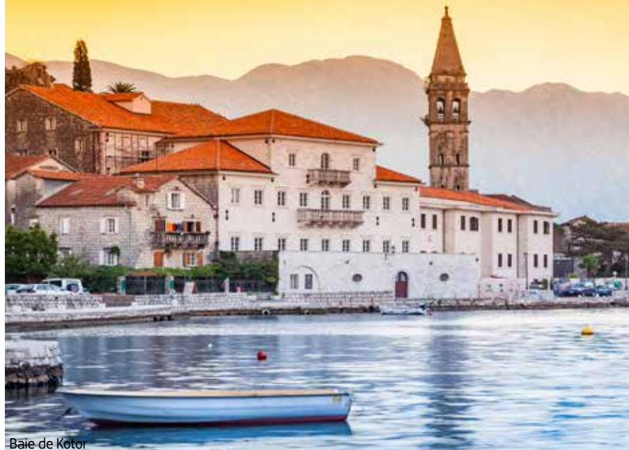
Baie de Kotor

palais de l'empereur romain Dioclétien, véritable cité dans la cité. Dîner libre et visite de Trogir, charmante petite ville médiévale, et de la cathédrale Saint-Laurent. Souper libre et nuit à Split. (PD)