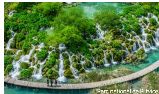
Parc national de Plitvice