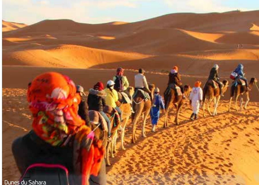
Dunes du Sahara