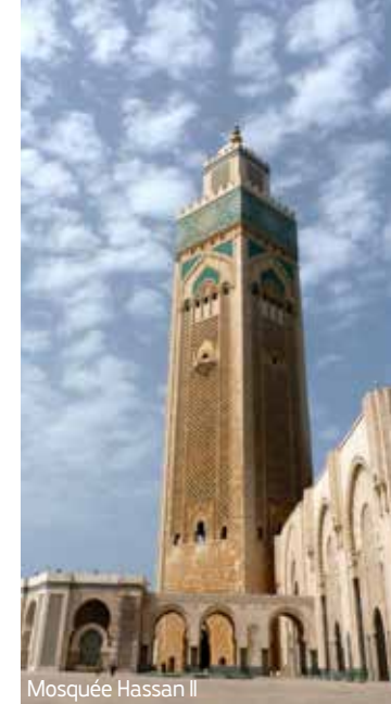
Mosquée Hassan II