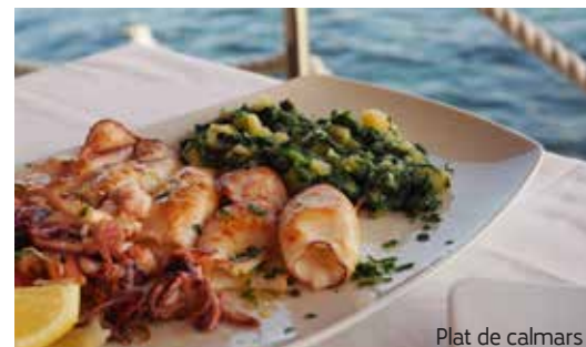
Plat de calmars