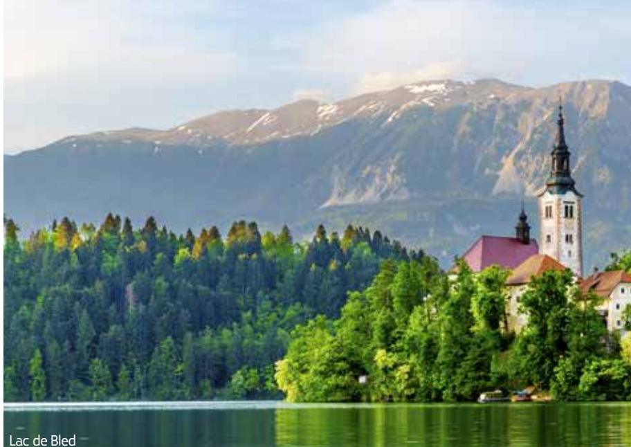
Lac de Bled