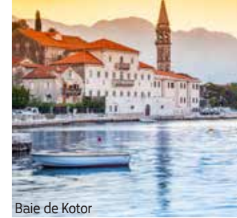
Baie de Kotor

Visite guidée de Split et son centre culturel, économique et touristique, puis visite du