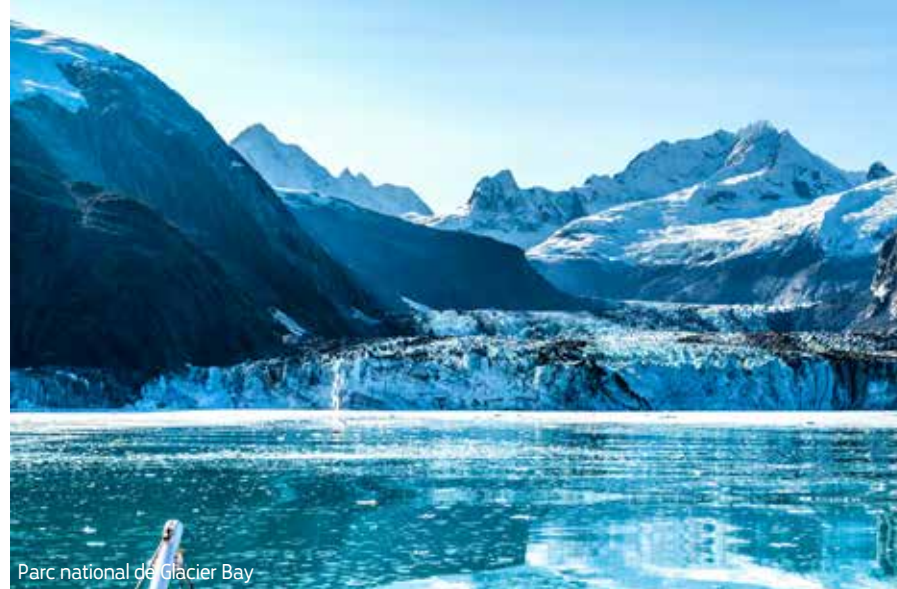
Parc national de Glacier Bay