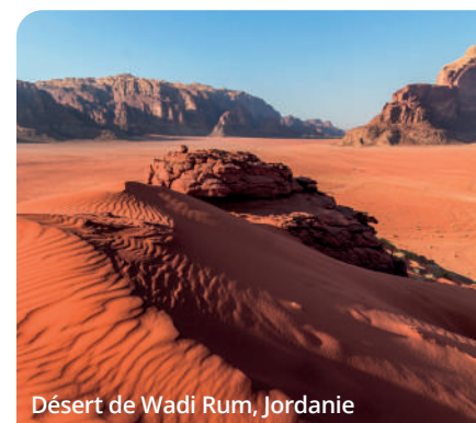
Désert de Wadi Rum, Jordanie

Transfert à l'aéroport et vols de retour vers Montréal, arrivée le jour même. (PD)