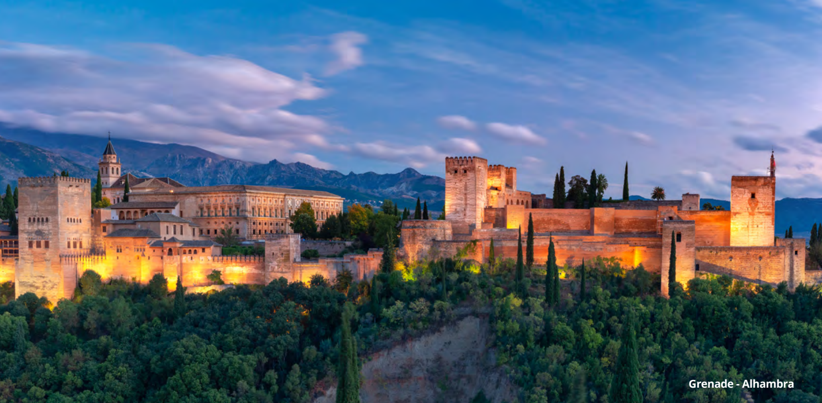
Grenade - Alhambra

pour visiter sa magnifique cathédrale et la célèbre forteresse Alcazaba, l'une des plus importantes constructions militaires musulmanes conservées en Espagne ! Retour à Torrox et dîner libre. Souper et nuit à l'hôtel. (PD/S).