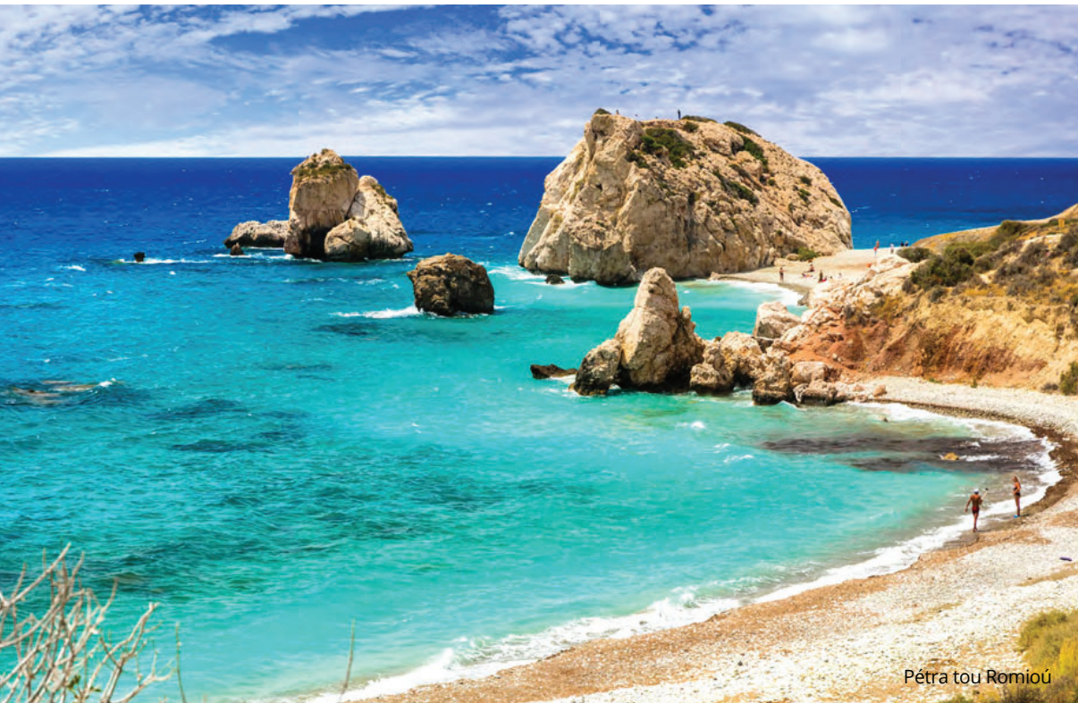
Pétra tou Romiou