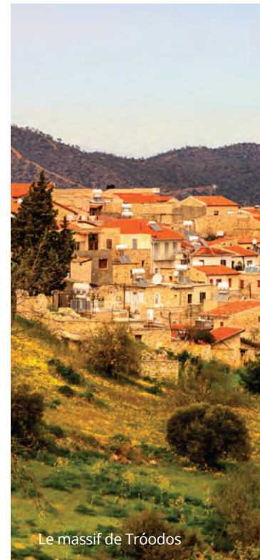
Le massif de Tróodos