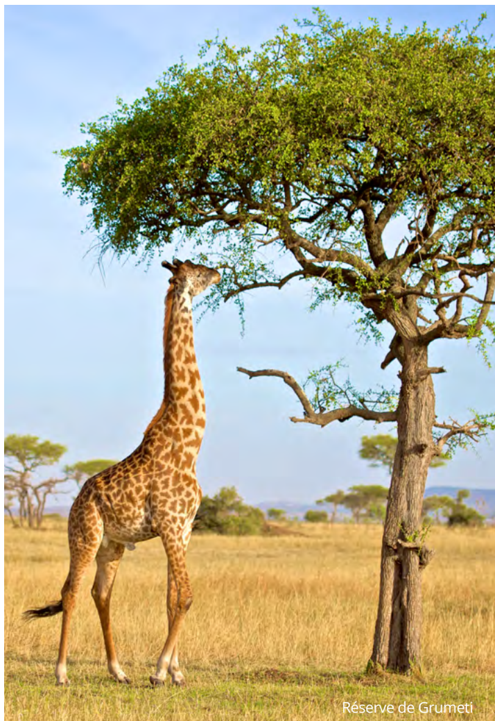
Réserve de Grumeti