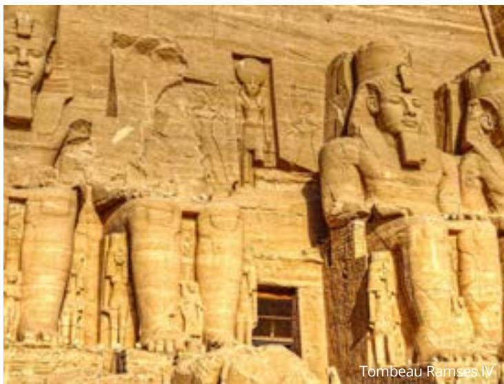
Tombeau Ramses IV

Petit-déjeuner à bord et départ pour la Vallée des Rois et des Reines, où vous aurez la chance d'observer 3 tombes. Ensuite, appréciez le site unique du temple d'Hatchepsout, seule femme à avoir montée sur le trône pharaonique,