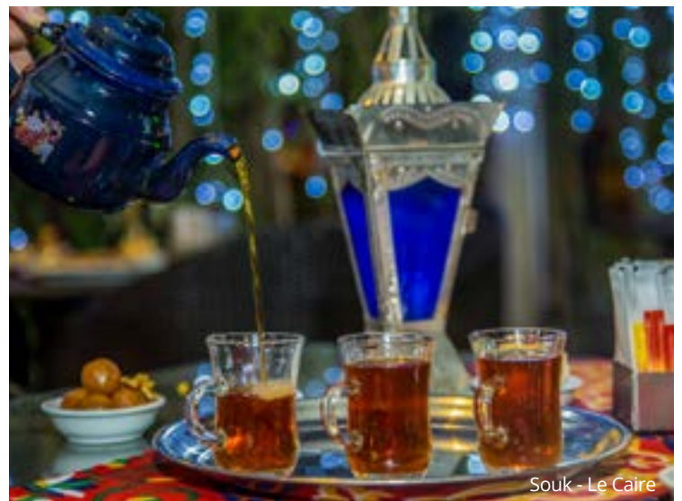
Souk - Le Caire