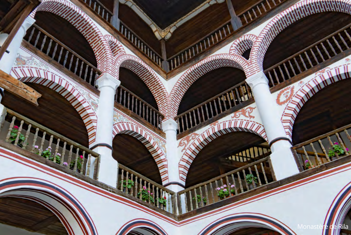
Monastère de Rila