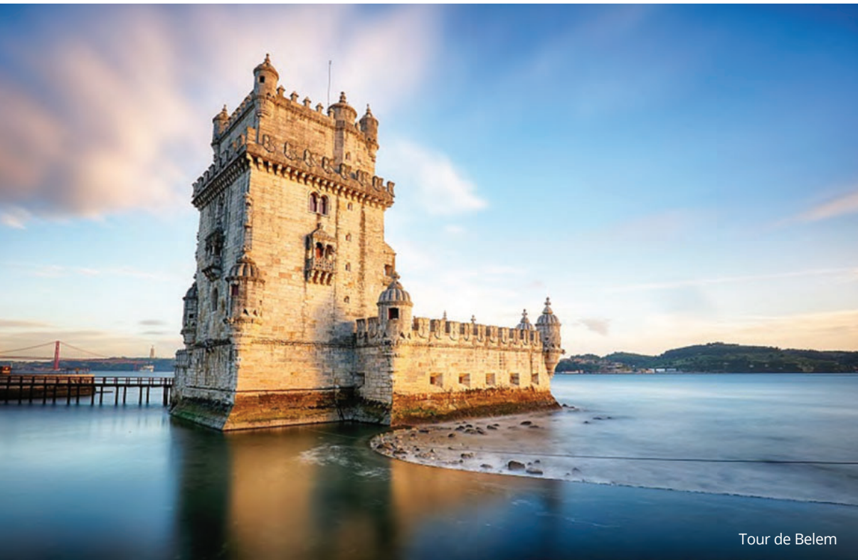
Tour de Belem