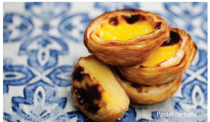
Pastel de nata