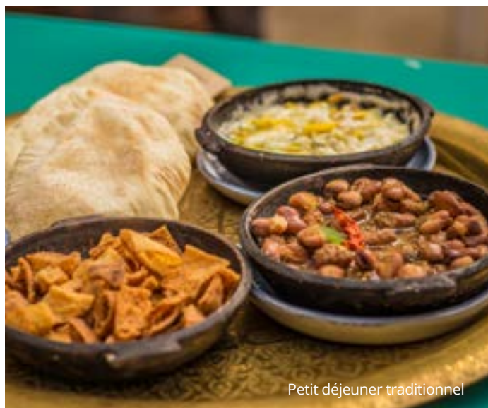
Petit déjeuner traditionnel