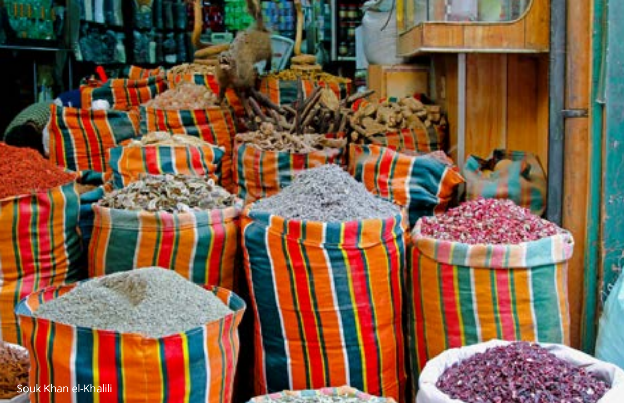
Souk Khan el-Khalili