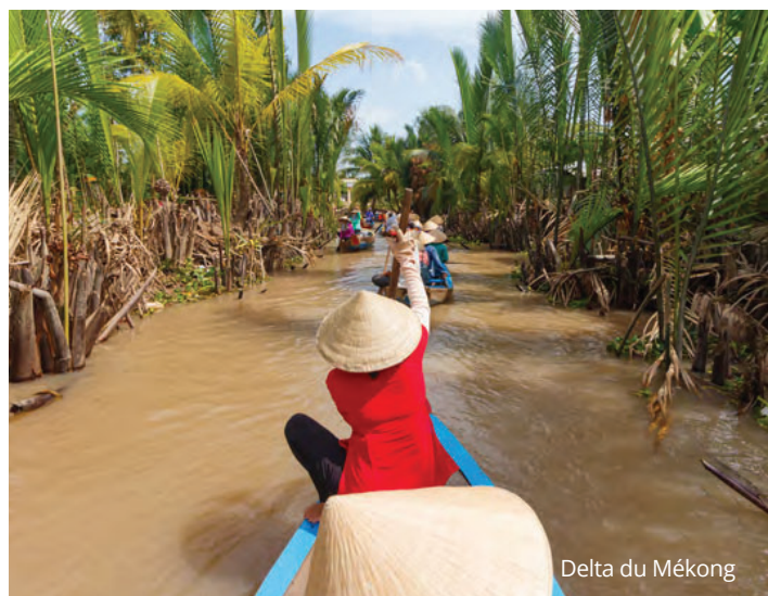
Delta du Mékong

Visite du musée d'Art Cham, puis route vers Huê par le col des Nuages,