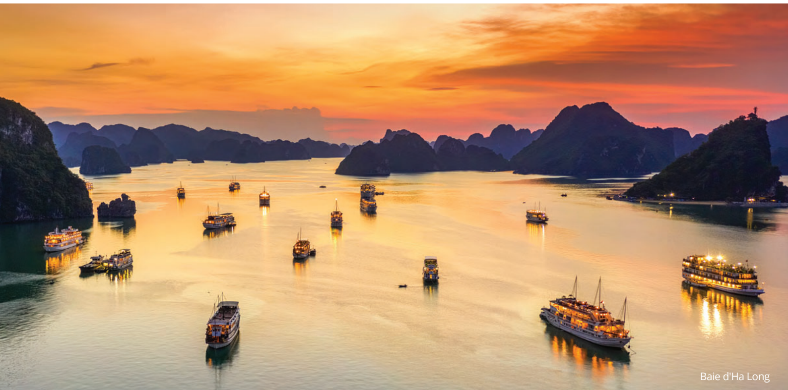
Baie d'Ha Long