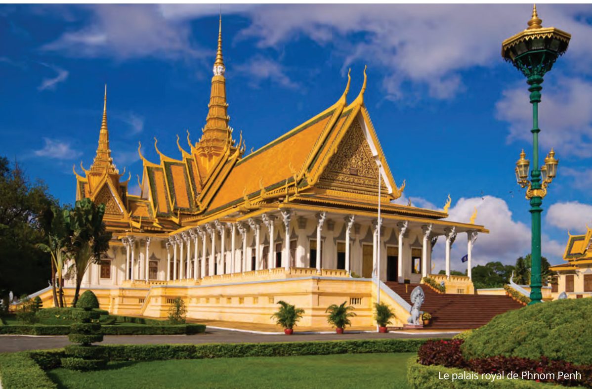
Le palais royal de Phnom Penh