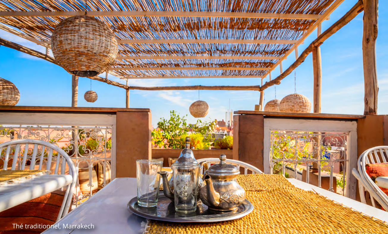
Thé traditionnel, Marrakech