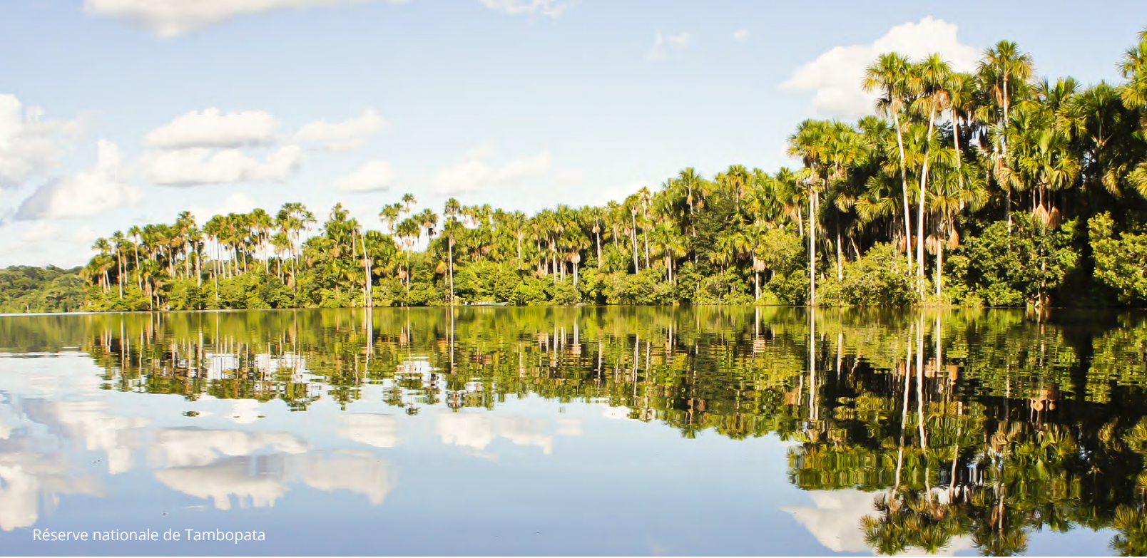
Réserve nationale de Tambopata