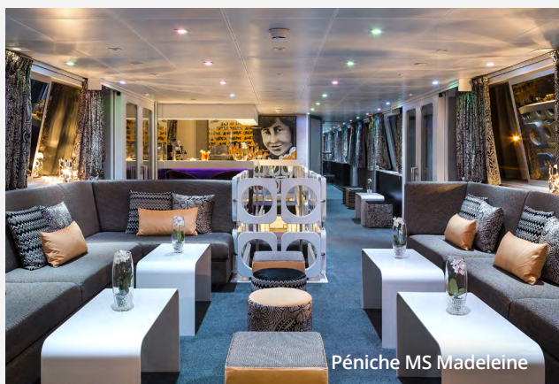
Péniche MS Madeleine

Le bateau est entièrement privatisé pour les clients d'IncurSION Voyages, soit 10 cabines doubles au pont principal. Vous pourrez ainsi bénéficier d'une intimité et d'un confort supérieur dans un petit groupe.