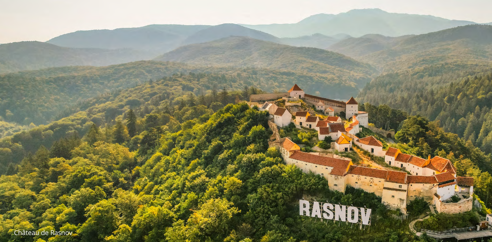
Château de Rasnov