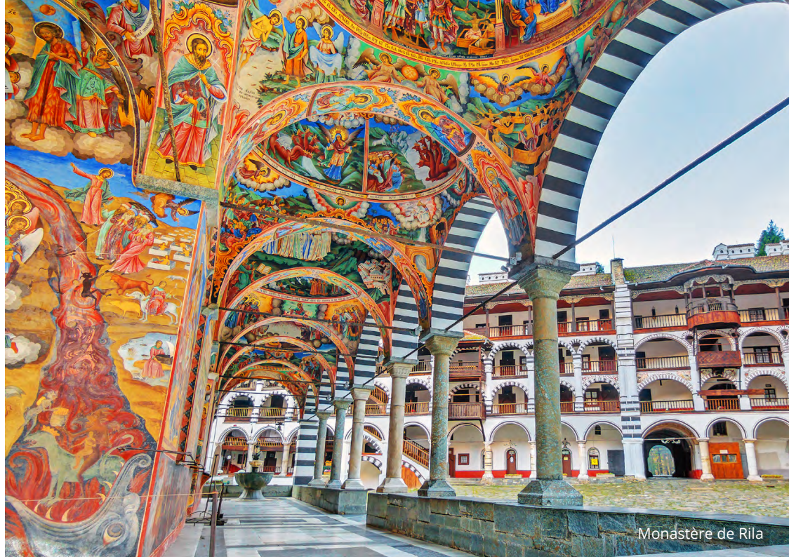
Monastère de Rila

de la rivière Yantra. Visite de la ville avec les ruines de sa forteresse royale et l'ancienne rue commerciale, bordée de petits ateliers d'artisans. Souper suivi d'un spectacle son et lumière en soirée. Nuit à Veliko Tarnovo. (PD/D/S)