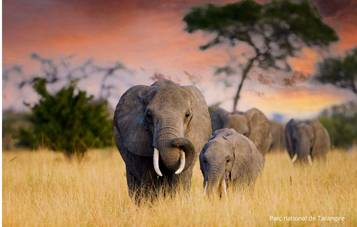
Parc national de Tarangire

dans le parc et route vers Grumeti. Installation et souper au lodge, puis safari de nuit à la rencontre des animaux nocturnes. Galagos, genettes et civettes sont au rendez-vous, de même que les animaux que vous avez déjà rencontrés et dont le comportement se transforme totalement la nuit tombée. Nuit au lodge. (PD/D/S)