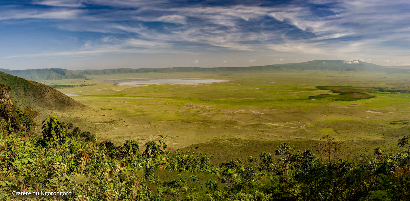
Cratère du Ngorongoro