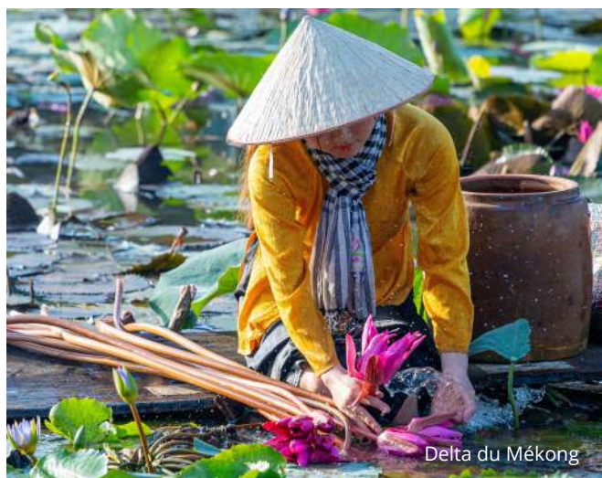
Delta du Mékong

Départ vers le village de Tra Que, puis randonnée optionnelle à vélo dans une ferme agricole du village. Introduction à l'histoire du village, à la culture des légumes et à l'utilisation de ceux-ci dans la médecine traditionnelle vietnamienne. Vous participerez aux activités de jardinage et cuisinerez avec un chef des spécialités locales. Dîner suivi d'une balade en bateau sur la rivière Thu Bon. Visite du vieux quartier d'Hoi An, qui compte plus de 844 bâtiments d'intérêt historique recensés par l'UNESCO. Souper libre et nuit à Hoi An. (PD/D)