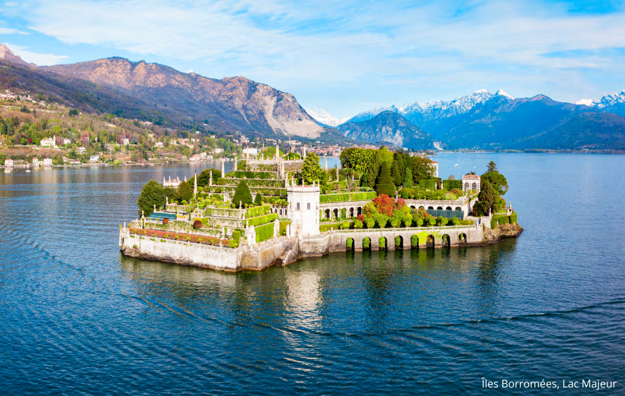
Îles Borromées, Lac Majeur