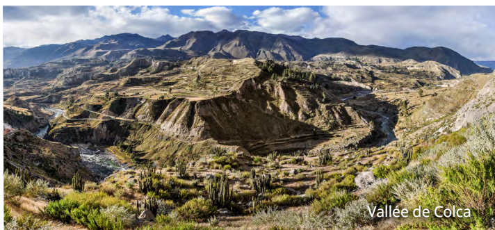
Vallée de Colca

Transfert tôt le matin vers l'aéroport de Lima pour les vols de retour vers Montréal, arrivée le jour même.