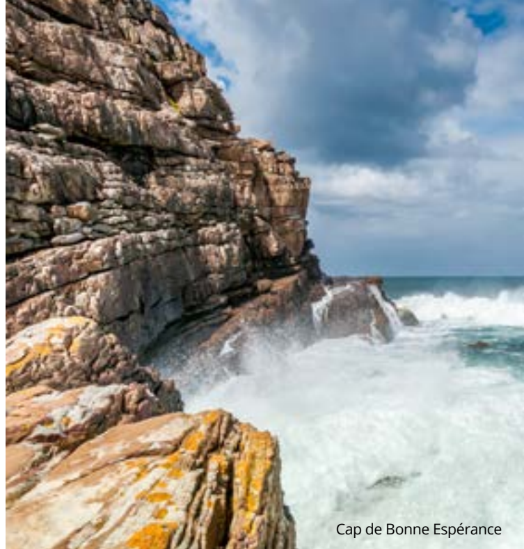
Cap de Bonne Espérance