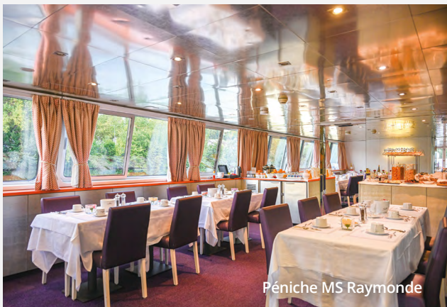
Péniche MS Raymonde

Le bateau est entièrement privatisé pour les clients d'Incursion Voyages, soit 10 cabines doubles au pont principal. Vous pourrez ainsi bénéficier d'une intimité et d'un confort supérieur dans un petit groupe.