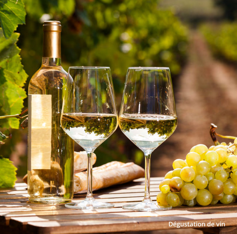
Dégustation de vin