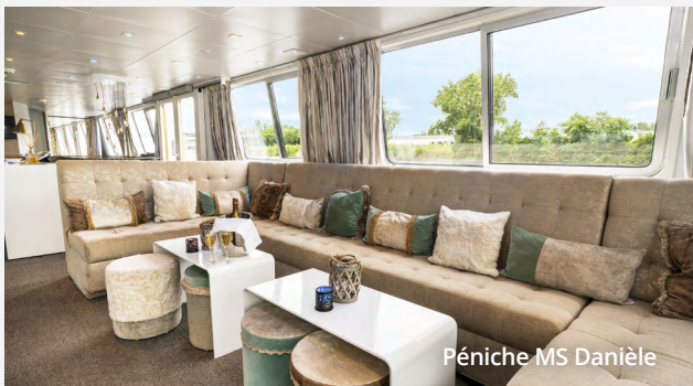
Péniche MS Danièle

Le bateau est entièrement privatisé pour les clients d'Incursion Voyages, soit 10 cabines doubles au pont principal. Vous pourrez ainsi bénéficier d'une intimité et d'un confort supérieur dans un petit groupe.