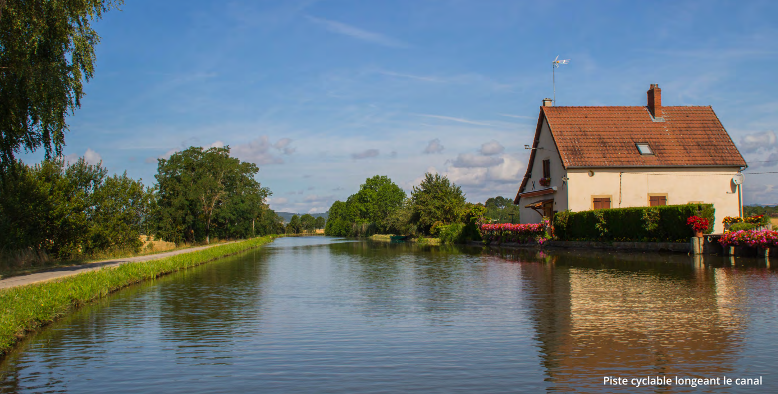
Piste cyclable longeant le canal