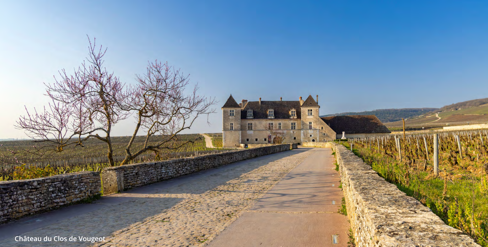
Château du Clos de Vougeot