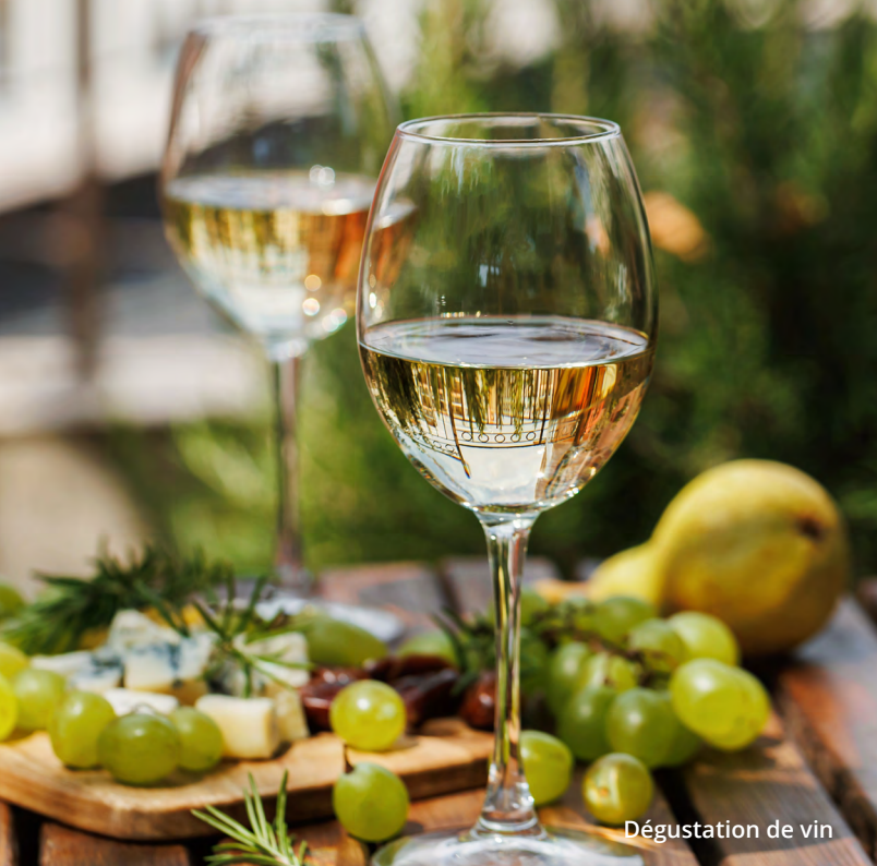
Dégustation de vin