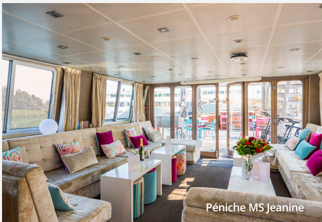
Péniche MS Jeanine

* Inclut le rabais Réservez-tôt de 400$ pour les 8 premiers voyageurs et le rabais paiement par chèque de 200$.